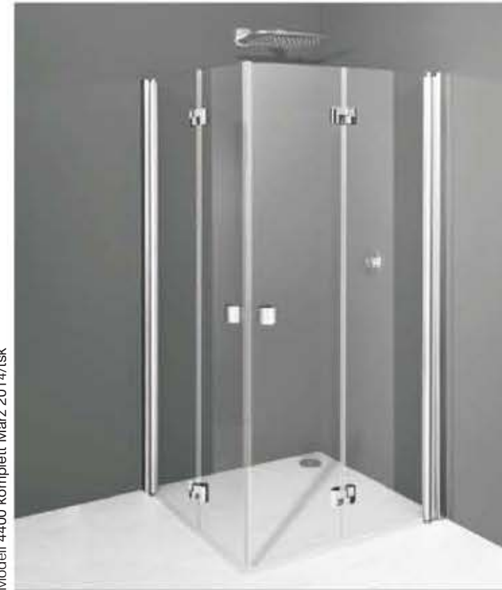
Modell 4400 komplett März 2014/tsk

Zum Aufbau benötigen Sie for mounting you need pour l'installation il vous faut