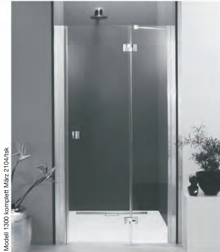
Modell 1300 komplett März 2104/tsk

Zum Aufbau benötigen Sie for mounting you need pour l'installation il vous faut