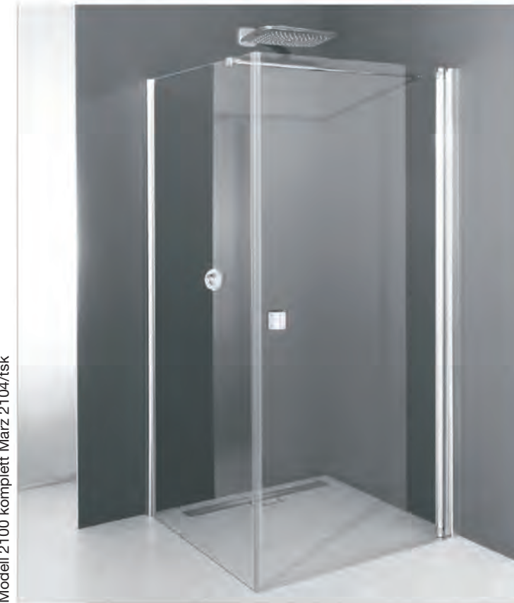
Modell 2100 komplett März 2104/tsk

Zum Aufbau benötigen Sie for mounting you need pour l'installation il vous faut