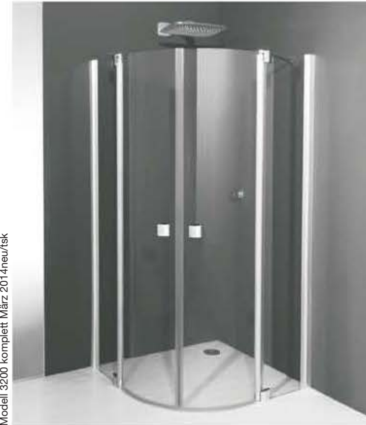
Modell 3200 komplett März 2014neu/1sk

Zum Aufbau benötigen Sie for mounting you need pour l'installation il vous faut