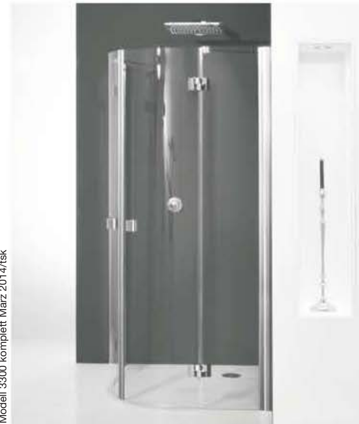
Modell 3300 komplett März 2014/tsk

Zum Aufbau benötigen Sie for mounting you need pour l'installation il vous faut